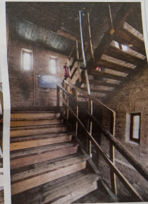
Trappan upp till tornet är bevarad i sin ursprungliga form.