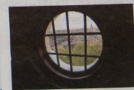
Stadsarkitekten Klas Boman byggnader kännetecknas ofta av vackra linjer och fönsten. Den runda formen kan ses på flera av hans byggnader i Falun.