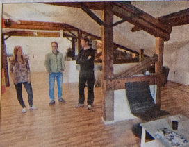
Vinden var tidigare oinredd. Nu är det moderna kontor. De stora bjälkarna har bevarats och är original.