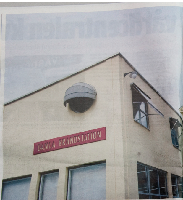
Huset som i dag ägs av företaget Gamla Brandstation AB inhyste förr brandmän och deras familjer. "Det var som en liten stad i staden".

ll bygga ideell för- sedan på cirka 100 i bevat- bygga 15 000 u stads ferna.