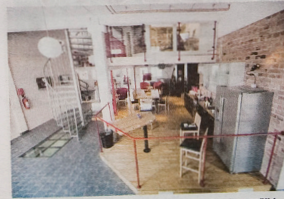
Köket i den gamla brandstationen är navet för de anställda. Här dricks det kaffe och bollas idéer. Den röda signaturfärgen syns här liksom i övriga delar av byggnaden.