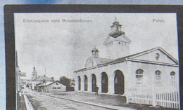
Den gamla brandstationen stod färdig 1911. Byggnaden lever än i dag och har fått tillbyggnader och blivit renoverad och har mycket historia kvar i väggarna. Många detaljer är original och flera av rummen berättar vad de varit från början, till exempel hösken, slangrummet och vinden.