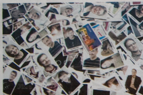
I dag arbetar ett 30-tal emansföretagare i den gamla brandstationen.